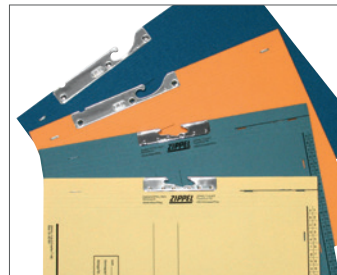
Pendelstangensystem Zippel, Leitz/Elba, andere Systeme auf Anfrage.