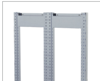
Doppelter Seitenrahmen zur beidseitigen Nutzung