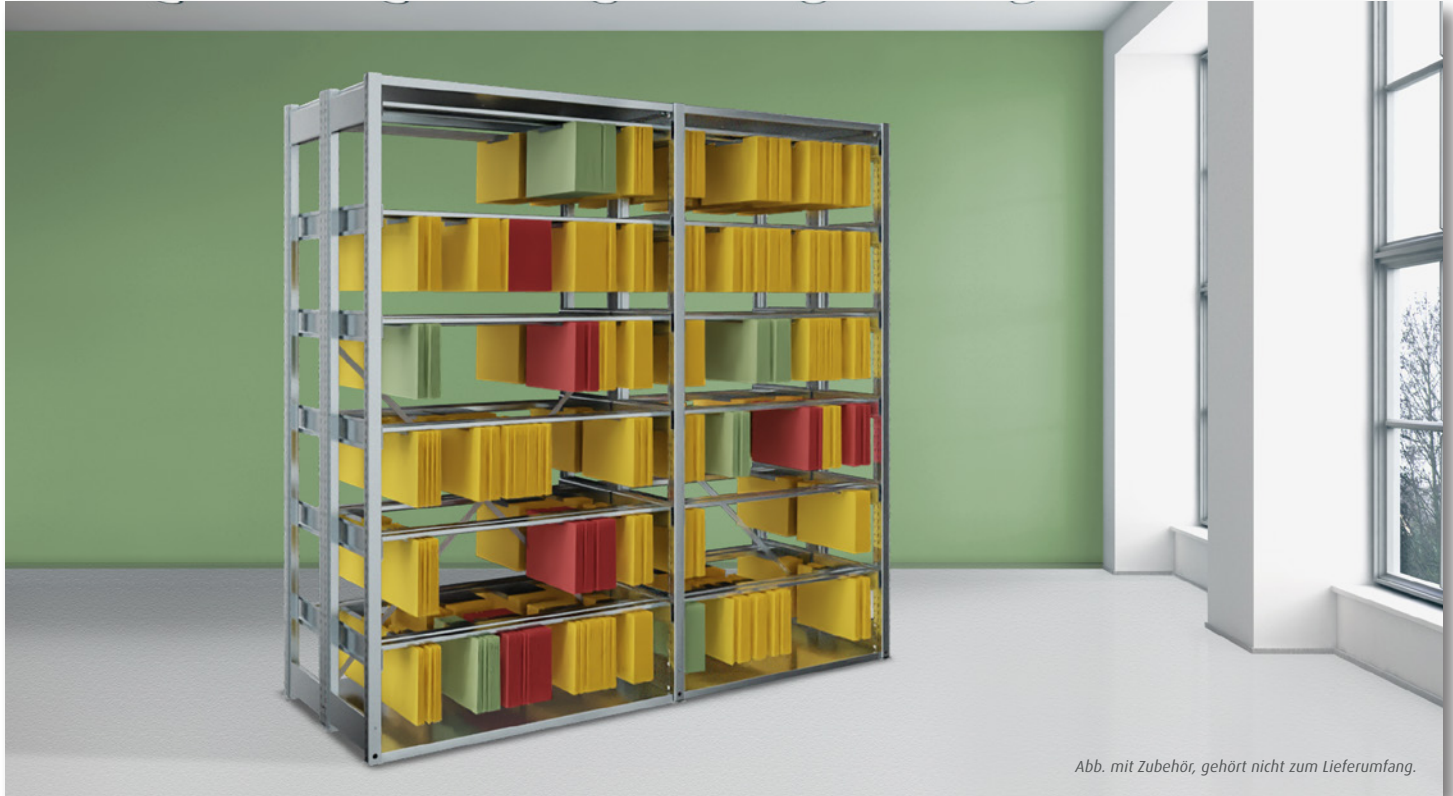
Abb. mit Zubehör, gehört nicht zum Lieferumfang.

Komplettregal doppelseitig mit Pendelstangen Leitz/Elba oder Zippel. Verzinkt.