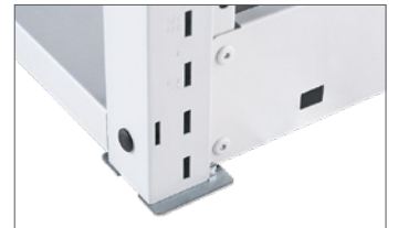
Rahmen auf Fußplatte.