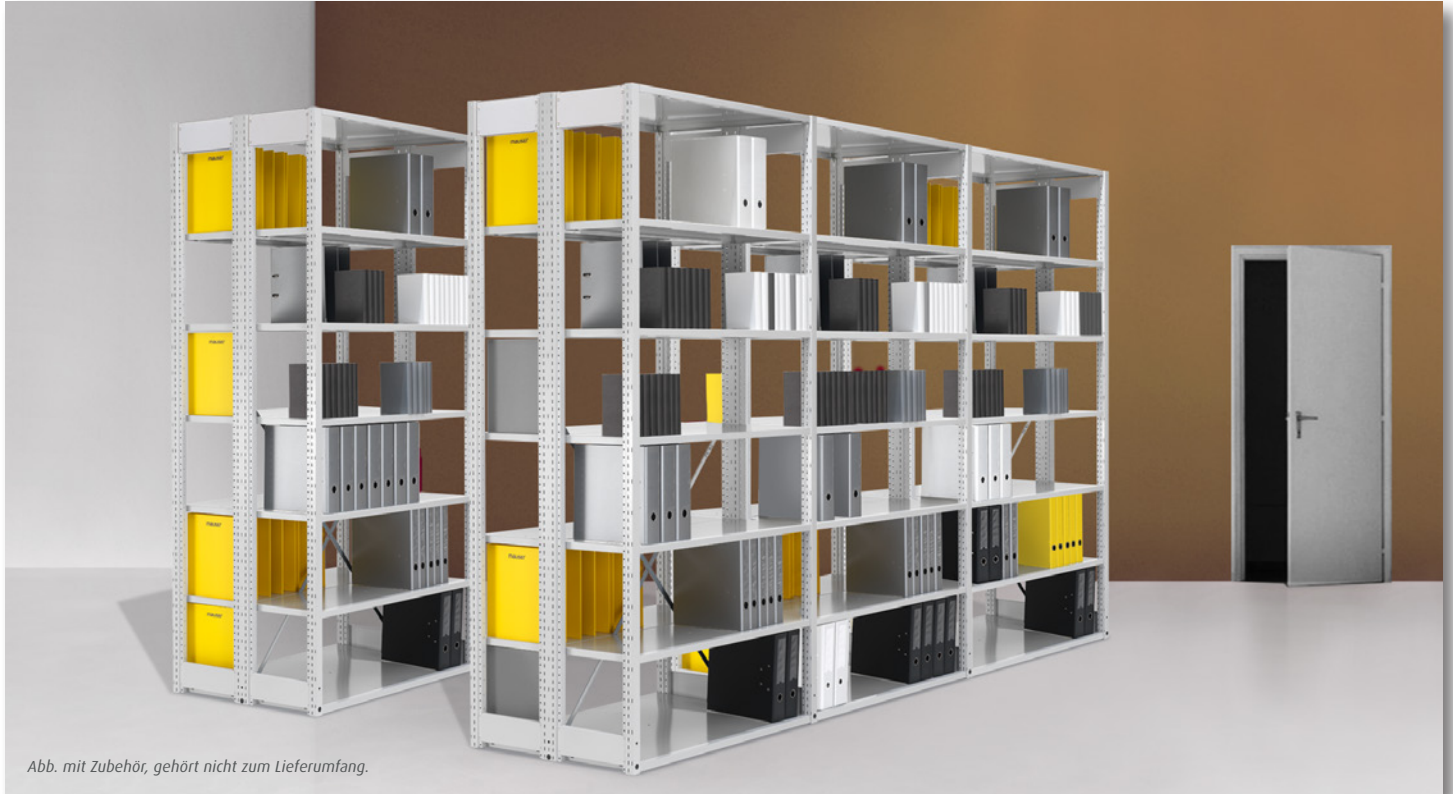
Abb. mit Zubehör, gehört nicht zum Lieferumfang.

Komplettregal doppelseitig mit Fachböden. Verzinkt oder lichtgrau pulverbeschichtet.