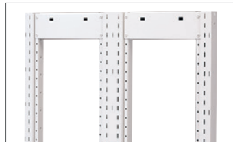
Die Seitenrahmen sind vorgefertigt.