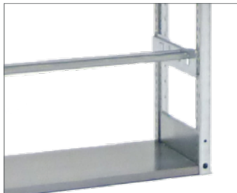
Pendelstange mit Träger und Sockelboden