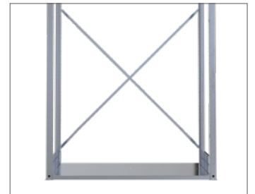
Stabilität durch Feld-Kreuzdiagonale.