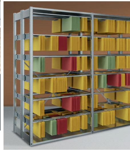
Abb. mit Zubehör, gehört nicht zum Lieferumfang.